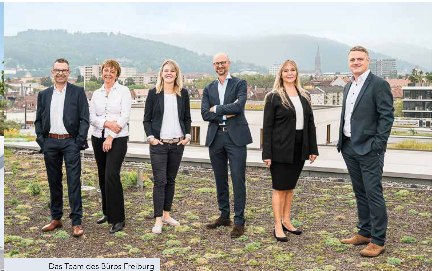
Das Team des Büros Freiburg