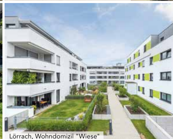
Lörrach, Wohndomizil "Wiese"