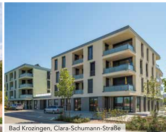
Bad Krozingen, Clara-Schumann-Straße