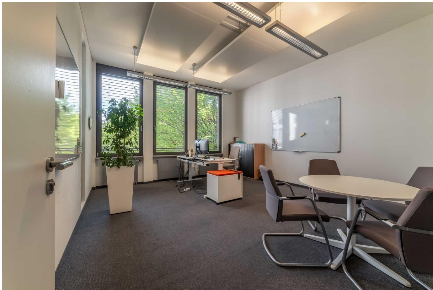
Impressionen 1. Obergeschoss