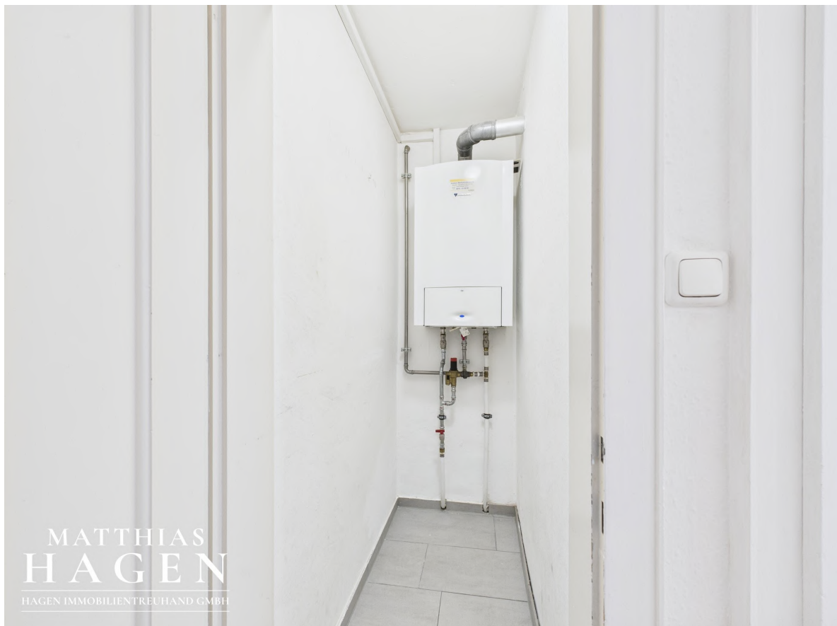
Abstell- und Heizraum