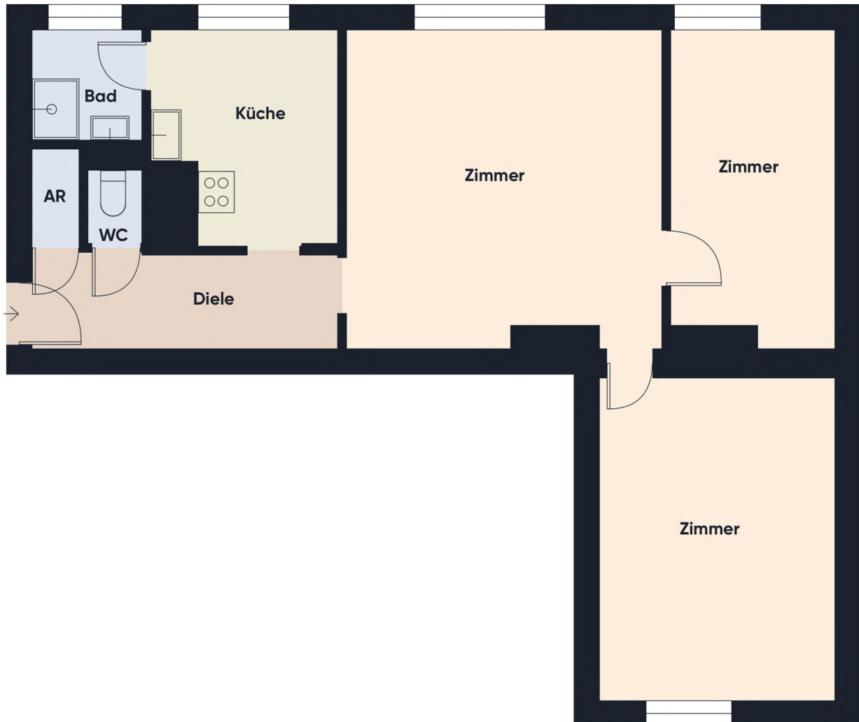
Grundrissplan ohne Maßstab