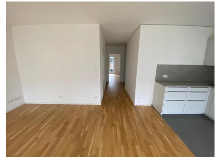
Wohnbereich mit offener Küche

Die U-Bahn-Linie (Pelikanstraße oder Spannhagengarten) liegt nur wenige Minuten entfernt, von dort gelangt man schnell in die City. Für den täglichen Bedarf ist ebenfalls gesorgt. Fußläufig erreichen Sie Einkaufsstätten, Ärzte, Apotheken, Schulen, Kindergärten usw.