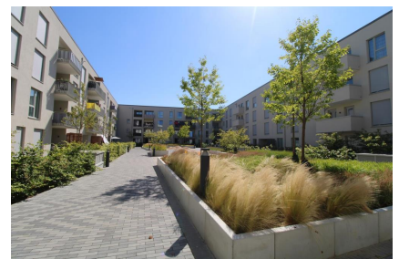
Ansicht vom Innenhof