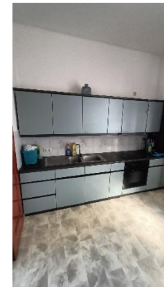
Küche im ersten OG