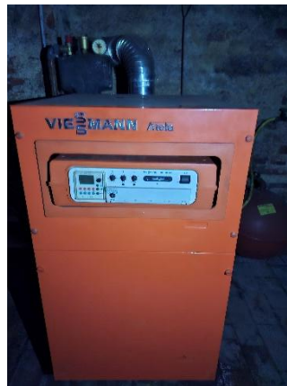
Zentralheizung im Keller