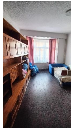
Wohnzimmer im ersten OG