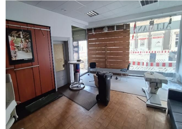
Gewerbeeinheit im EG