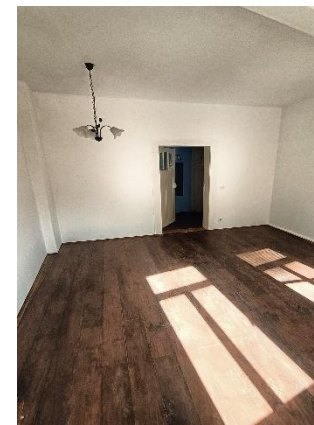
Wohnung im 2. OG