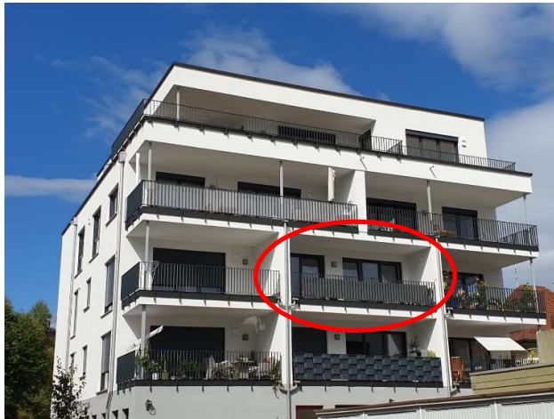
Großer Balkon, Südseite