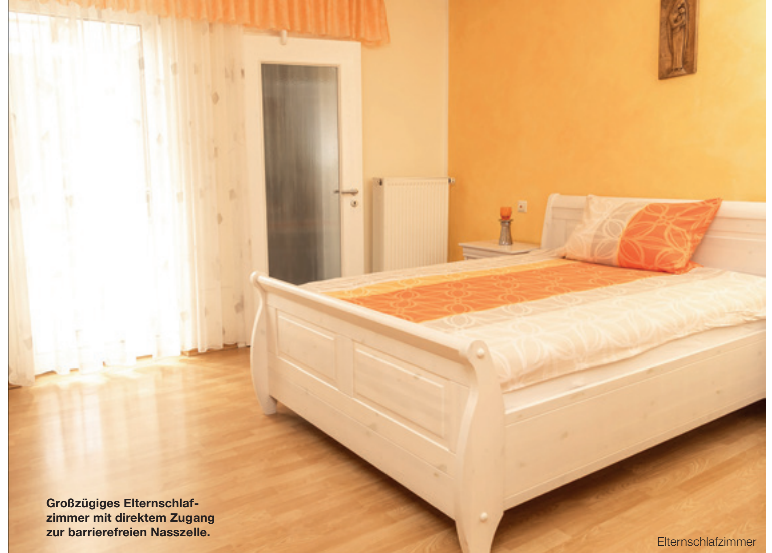
Großzügiges Elternschlafzimmer mit direktem Zugang zur barrierefreien Nasszelle.