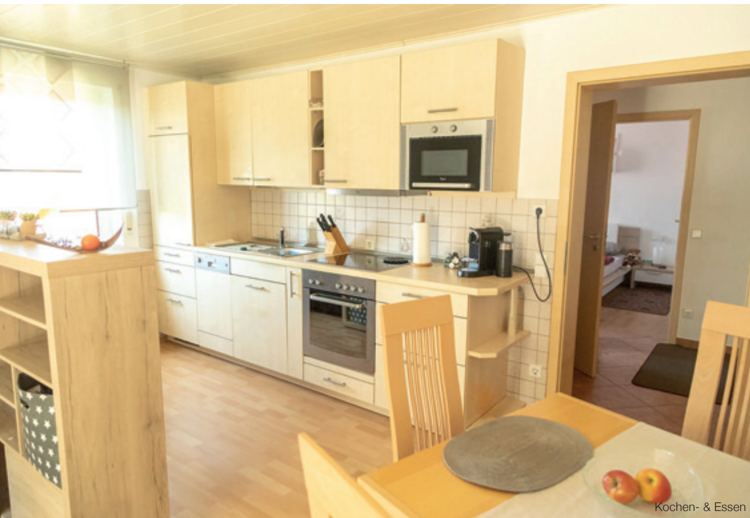
Kochen- & Essen