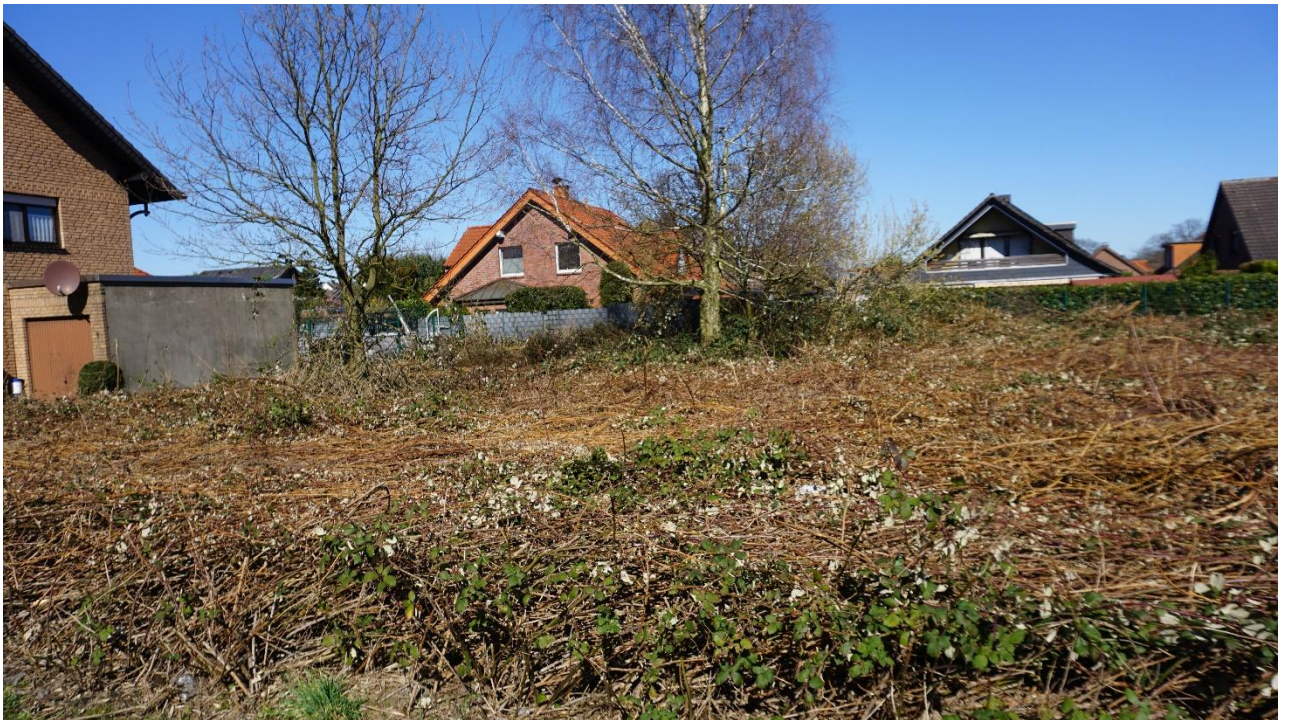
Übersicht Eingangsbereich Straßenseite