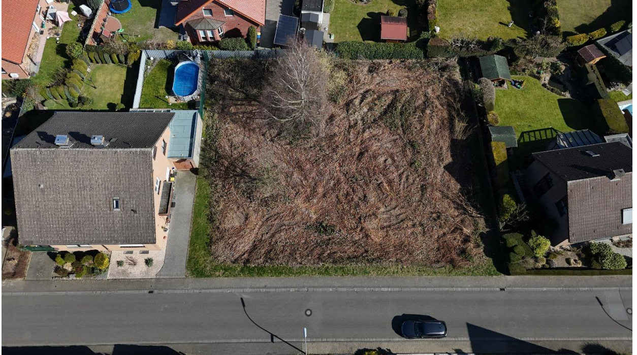
Bild von oben

Die nördliche Ausrichtung, wie abgebildet, bietet ganzjährig ein Maximum an Sonne