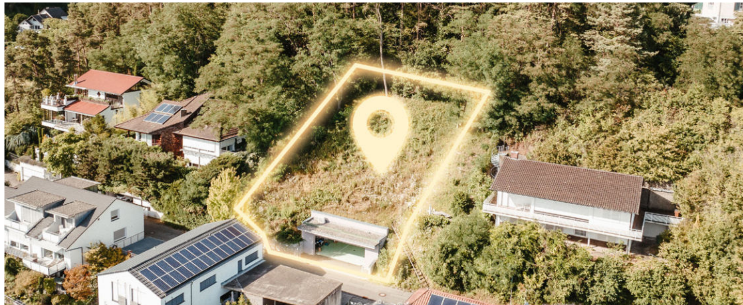
• The Pearl - Exklusives Hanggrundstück mit Garage