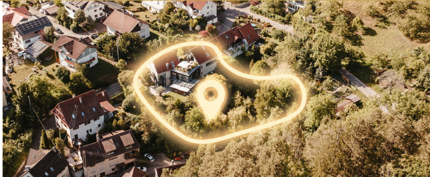
• The Pearl - Luxusanwesen mit Seesicht

Es handelt sich einmal um eine luxuriöse Villa mit privatem Hallenbad und einem spektakulären Garten. Zum anderen um ein weiteres Hanggrundstück, bereits mit einer Garage bebaut, welches atemberaubenden Blick auf den See bietet.