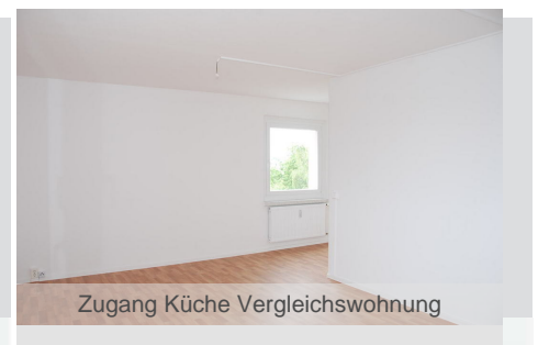
Zugang Küche Vergleichswohnung