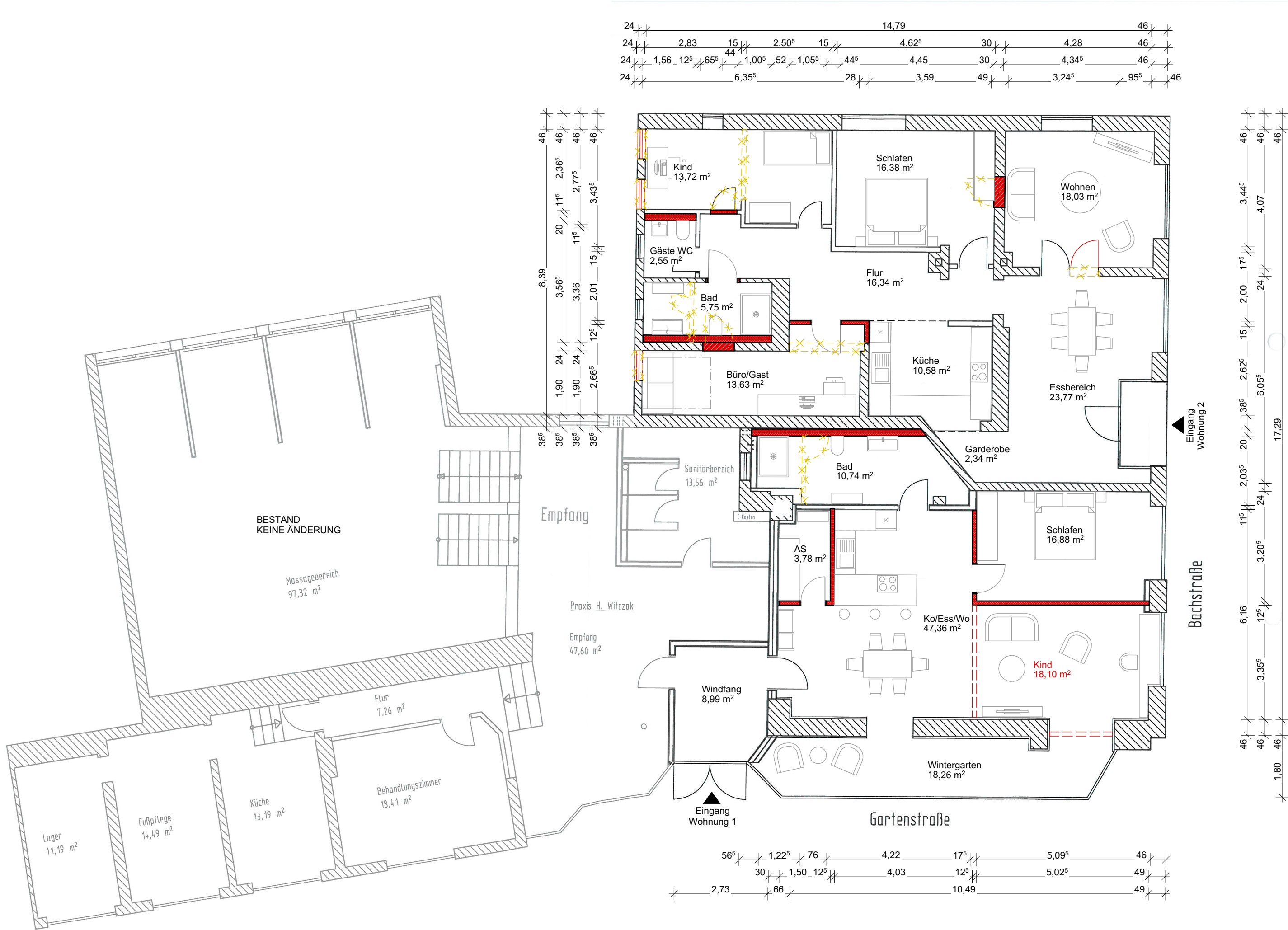
Grundriss EG Maßstab 1:100