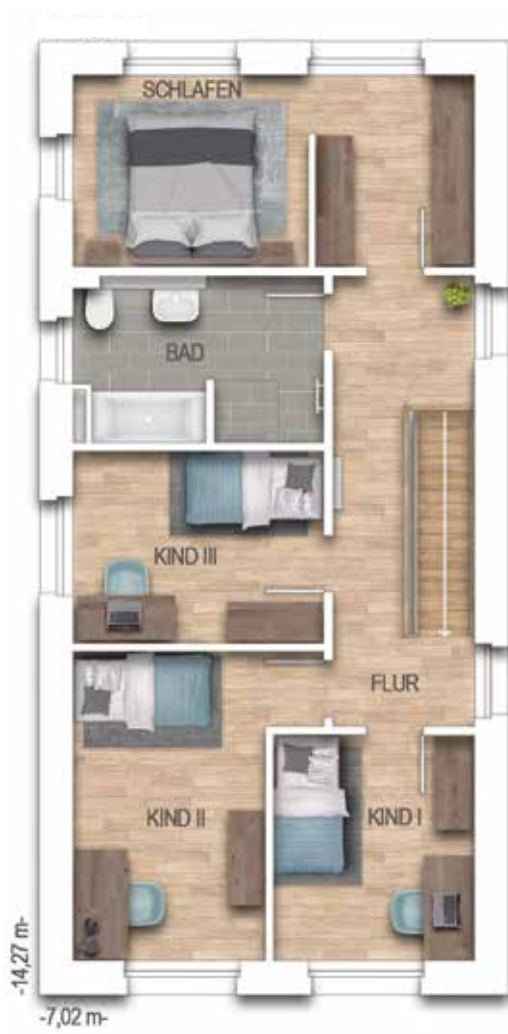
69733 1. OG

Erweiterung 15 m² Terrassen- fläche möglich (laut Baugenehmigung)