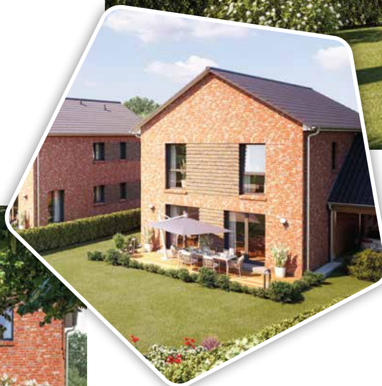
Die Abbildungen der Häuser sind unverbindliche Visualisierungen und zeigen Ausstattungsvarianten.