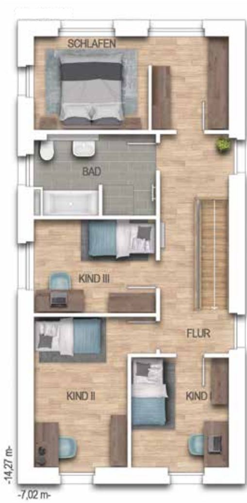
69732 1. OG

Erweiterung 15 m² Terrassen- fläche möglich (laut Baugenehmigung)