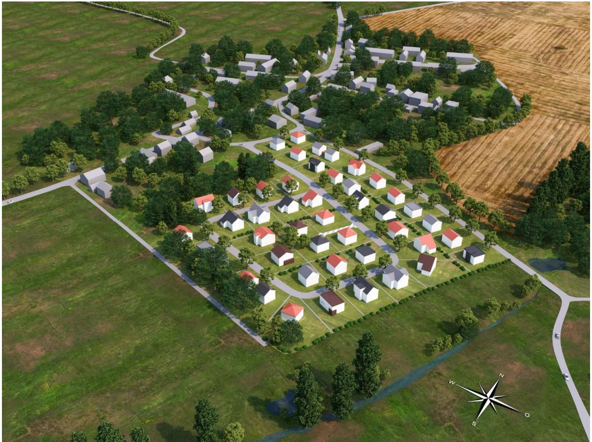
Blick auf das Baugebiet mit der möglichen Bebauung