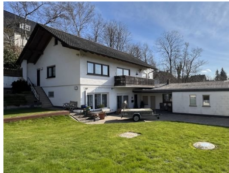
Haus 3: Ansicht Einfamilienhaus