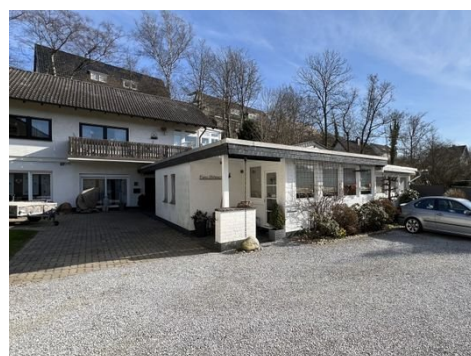
Haus 2: Ansicht Bungalow