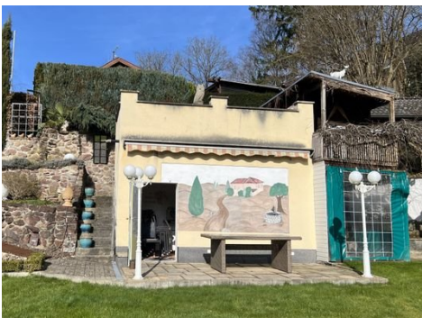
Ansicht Gartenhaus mit Terrasse