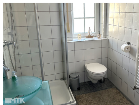
Gäste WC mit Dusche