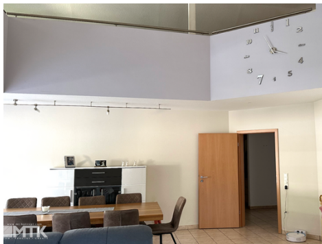
Wohnzimmer mit Blick auf Empore