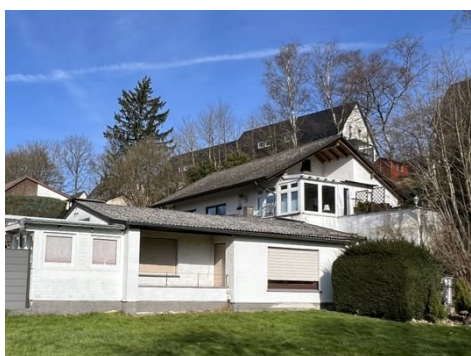
Haus 2: Ansicht Bungalow