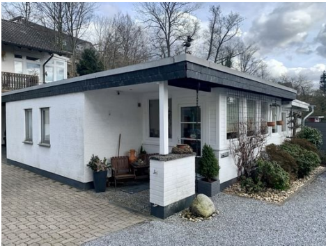
Haus 2: Ansicht Bungalow