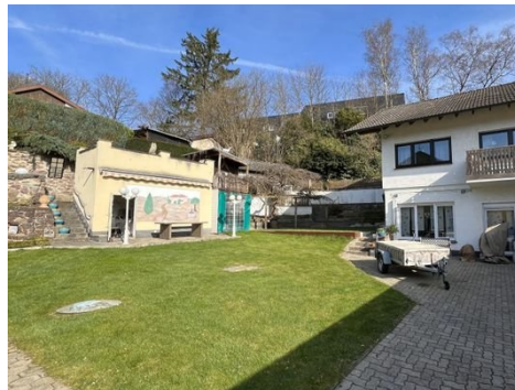
Ansicht Gartenhaus mit Terrasse