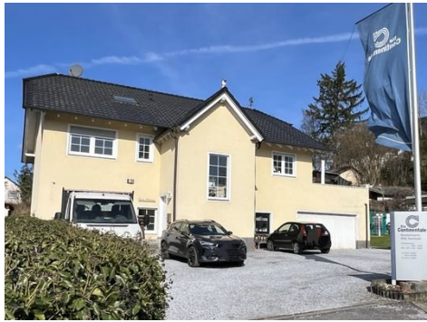
Haus 1: Ansicht Zweifamilienhaus