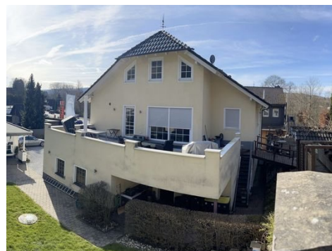
Haus 1: Dachterrasse Zweifamilienhaus