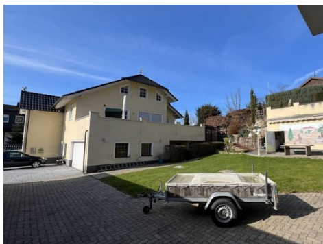
Haus 1: Ansicht Zweifamilienhaus