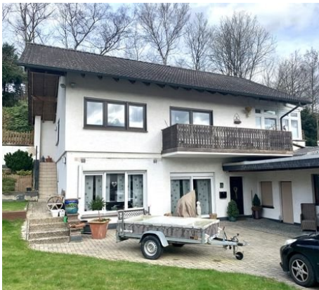
Haus 3: Ansicht Einfamilienhaus