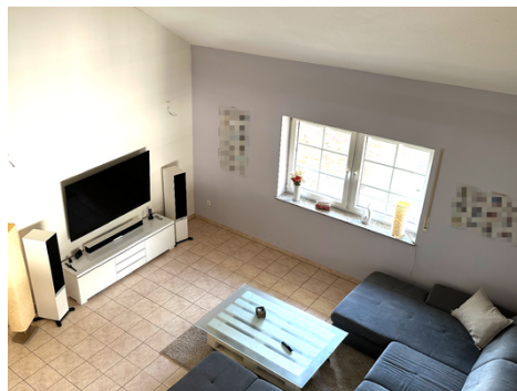
Wohnzimmer Blick von Empore