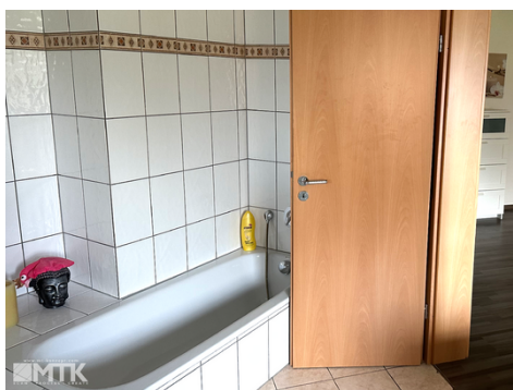
Badezimmer mit Wanne