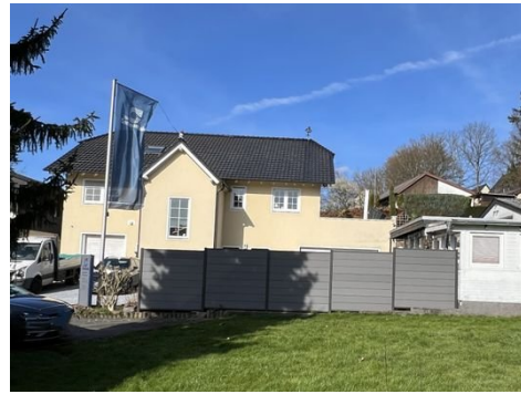
Haus 1: Ansicht Zweifamilienhaus