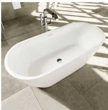
frei stehende Badewanne