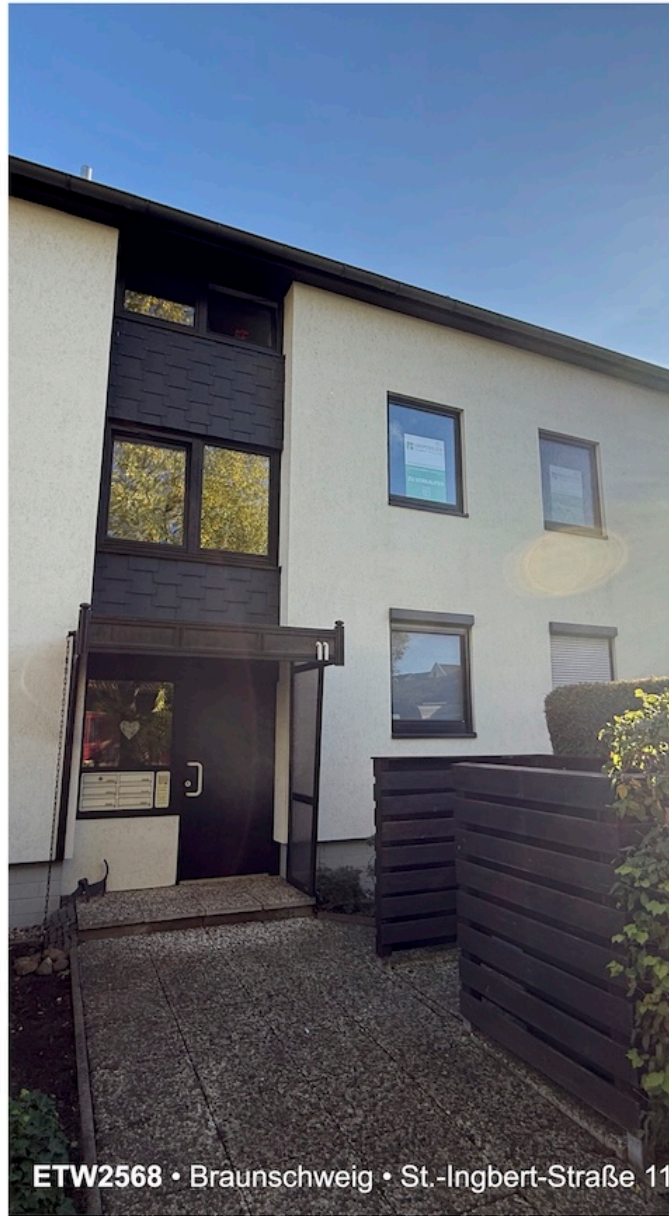
ETW2568 • Braunschweig • St.-Ingbert-Straße 11