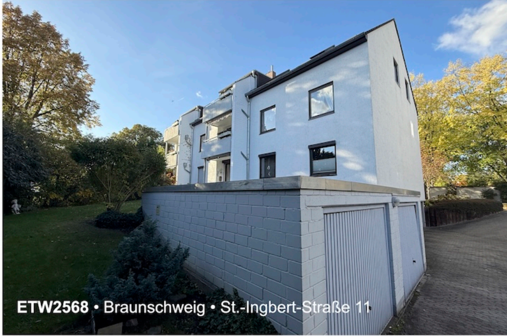
ETW2568 • Braunschweig • St.-Ingbert-Straße 11